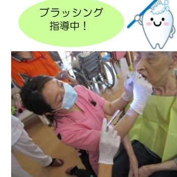
ブラッシング指導中!

ハート歯科さんと連携し、口腔ケアについての取り組みを行っています。ブラッシング指導や管理方法等の助言を定期的に頂き、口腔機能の向上を目指します。