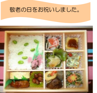
敬老の日をお祝いしました。