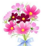
たくさんあるので迷います。

グループホームティアラでは「心身ともに健康に過ごせる」を今年度の目標としています。今年の夏は猛暑でしたが、皆さん元気に過ごすごうことができました。