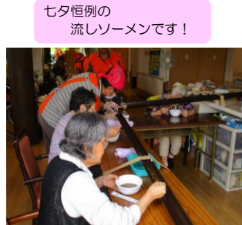
七夕恒例の流しソーメンです!

7月には七夕恒例の流しソーメンを行いました。今年は猛暑でしたが、少しでも涼しい雰囲気を楽しんでもらえたいと思います。またお稲荷さんをご利用皆様と一緒に作っています。