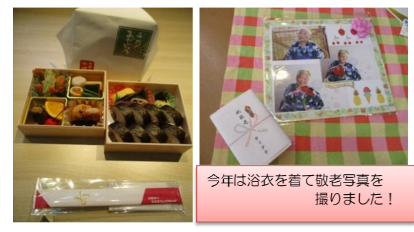
今年は浴衣を着て敬老写真を撮りました!

食の楽しみを持って頂けるよう、毎月テーマを決めて食事の提供を行っています。8月はフロアをパン屋さんの様に飾りつけを行っています。色々な種類のパンを並べ選ぶ楽しみを持って頂きました。夏の間も水分補給を工夫して十分に行えました。