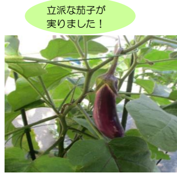
立派な茄子が実りました!

園芸療法の活動を行っています。認知症の進行予防や精神の安定に繋がる効果を期待しています。春に植えた夏野菜がたくさん育ちました。収穫の楽しみを感じて頂くことができました。